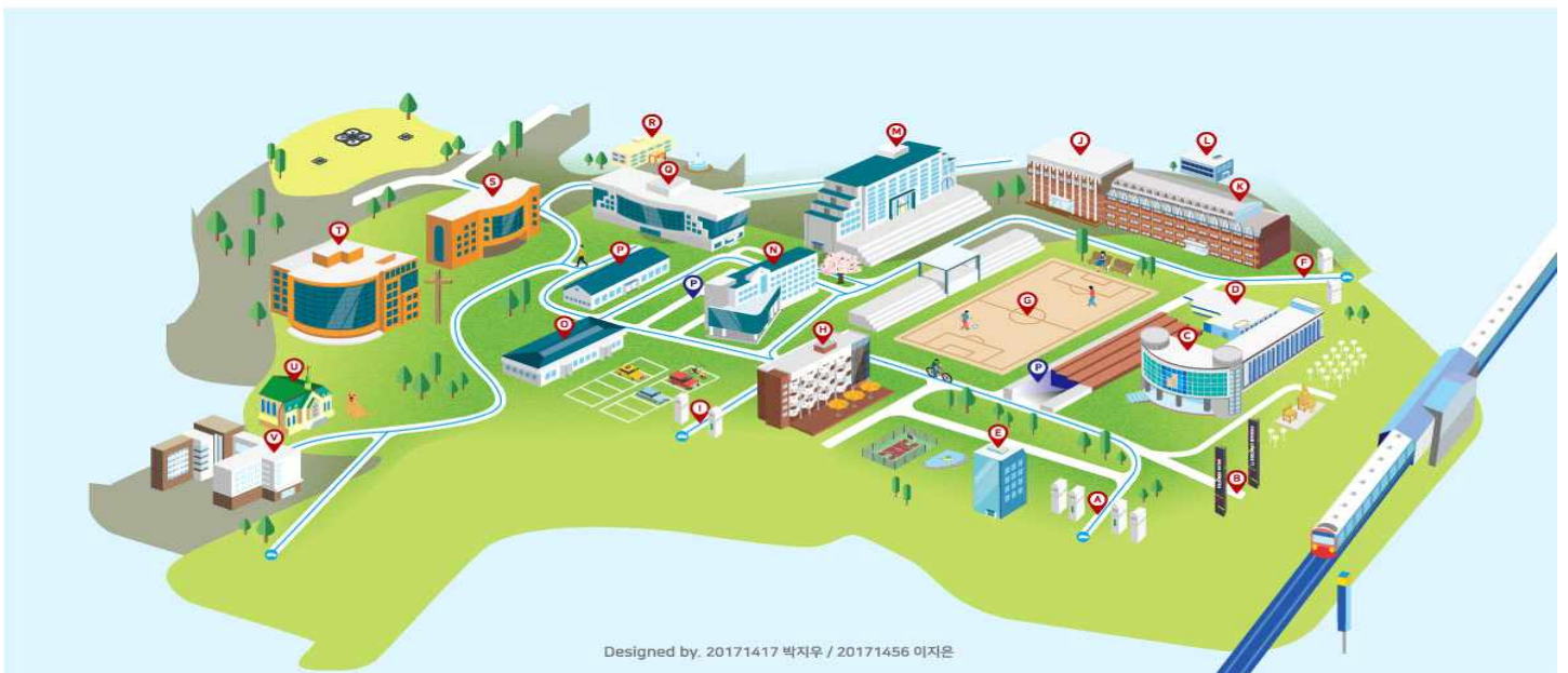
Designed by. 20171417 박지우 / 20171456 이지은

의정부캠퍼스 : (우 11644) 경기도 의정부시 호암로 95 / TEL. 031-870-3114