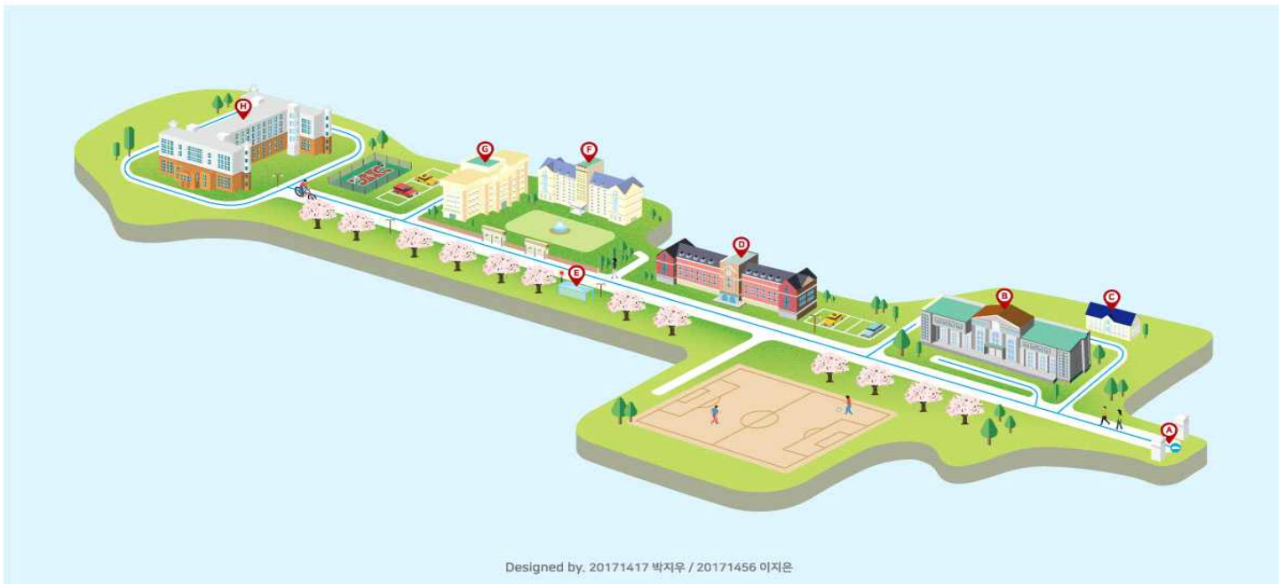
Designed by. 20171417 박지우 / 20171456 이지은

동두천캠퍼스 : (우 11340) 경기도 동두천시 별마들로 40번길 30 / TEL. 031-870-2900